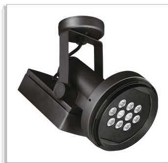
Magneos LED Projector Compact BCS501 for baseplate mounting, with 10, 20 or 30° beam