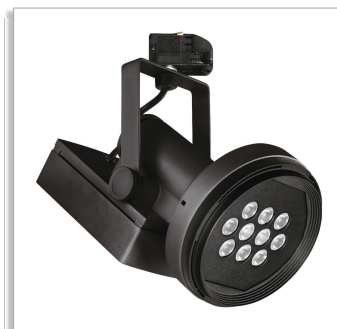
Magneos компактный светодиодный прожектор BRS501 для монтажа на шинпровод со световым пучком 10, 20 или 30°