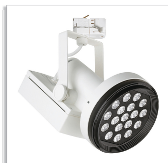
Magneos компактный светодиодный прожектор BRS501 для монтажа на шинпровод со световым пучком 10, 20 или 30°