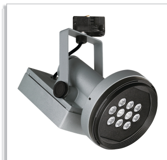
Magneos LED Projector Compact BRS501 for track mounting, with 10, 20 or 30° beam