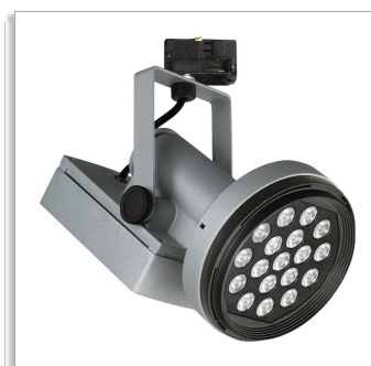
Magneos LED Projector Compact BRS501 for track mounting, with 10, 20 or 30° beam