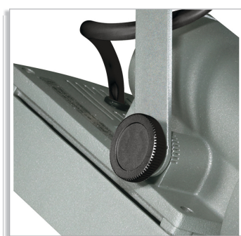
Magneos Compact MRS501 прожектор с системой точного регулирования и индикатором для определения угла светового пучка